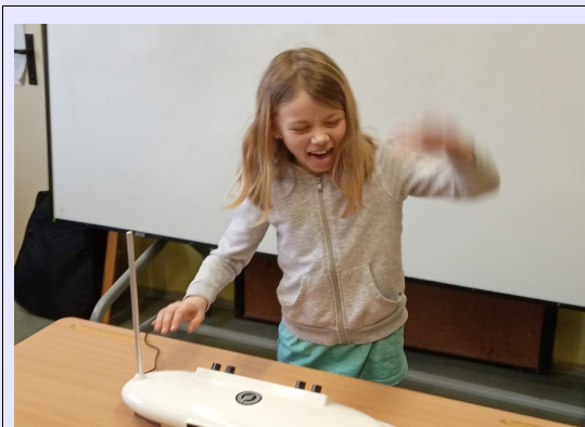
Zážitky z hraní na theremini jsou neomezené.

Theremin se objevuje především v experimentální hudbě. Ve 2. pol. 20. stol. to byl oblíbený nástroj pro dokreslení filmové atmosféry v hororech a fantastických filmech. Ve vážné hudbě zaznívá např. ve skladbách Johna Cage či Bohuslava Martinů. V populární hudbě ho použila např. skupina Led Zeppelin (skladba Whole Lotta Love), Plastic People of the Universe či Jean Michael Jarre. Pokud se v televizi díváte na seriál Vraždy z Midsomeru, zaposlouchajte se do znělky seriálu. Ano, také tam je theremin slyšet. Mladší generace si možná vybaví úvodní melodii z počítačové hry The Legend of Zelda, kde theremin určitě poznáte. Pokud Vás tento hudební nástroj okouzlí, je dnes běžně k dostání v hudebních obchodech.